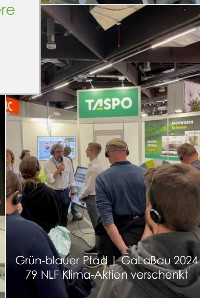
Grün-blauer Pfad | GaLaBau 2024 79 NLF Klima-Aktien verschenkt