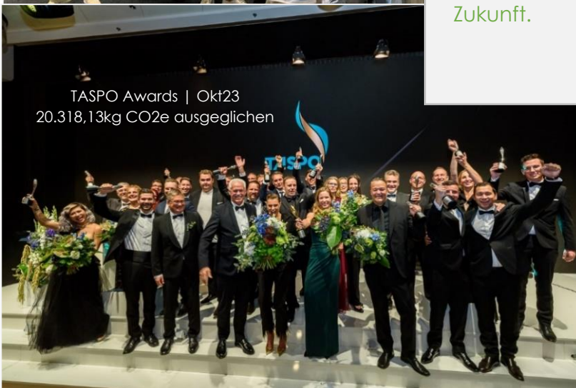
TASPO Awards | Okt 23 20.318,13kg CO2e ausgeglichen