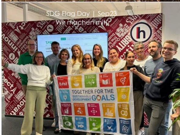
SDG Flag Day | Sep 23 Wir machen mit!