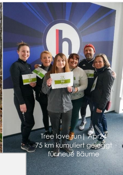
Tree love run | Apr 24 75 km kumuliert gejoggt für neue Bäume