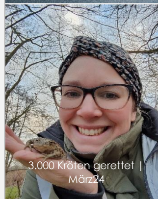
3.000 Kröten gerettet | März 24

Wir sorgen auf vielen Ebenen zusammen für eine nachhaltigere Zukunft.