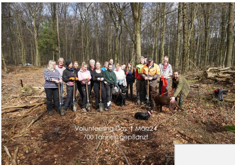
Volunteering Day | 1. März 24 700 Tannen gepflanzt